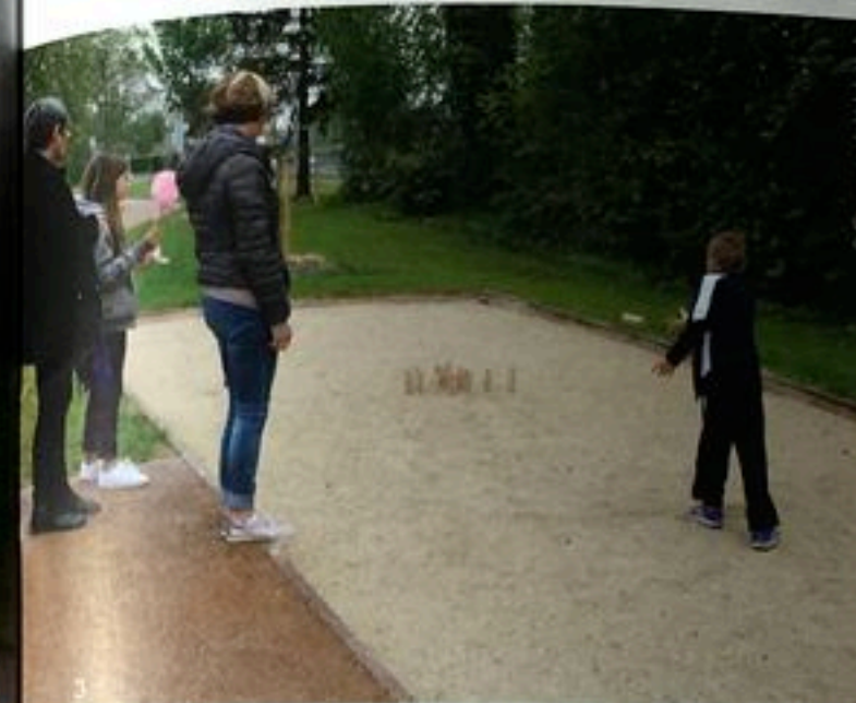
3/ Bouledromes, aires de jeux, stations de fitness, tables de pique-nique, parcours vélo... les habitants peuvent désormais profiter d'activités en plein air, le tout étant aménagé avec des matériaux simples et durables.

Le parc s'adosse ainsi à la végétation de bord de rivière et sur le grand paysage des champs cultivés. La palette végétale variée et indigène, s'appuie sur la végétation de la ZNIEFF des Marais du Val de Vesle située non loin de là. Au total, 41 arbres ont été plantés, dont des chênes, érables, charmes, aulnes, saules pleureur et arbres fruitiers (poiriers, cerisiers, pommiers) ainsi que 574 arbustes (charmilles, noisetiers, cornouillers, fusains, traènes, sureaux noirs et viornes) plantés en perspective pour ouvrir des horizons lointains sur les champs" précise Ariane Smythe.